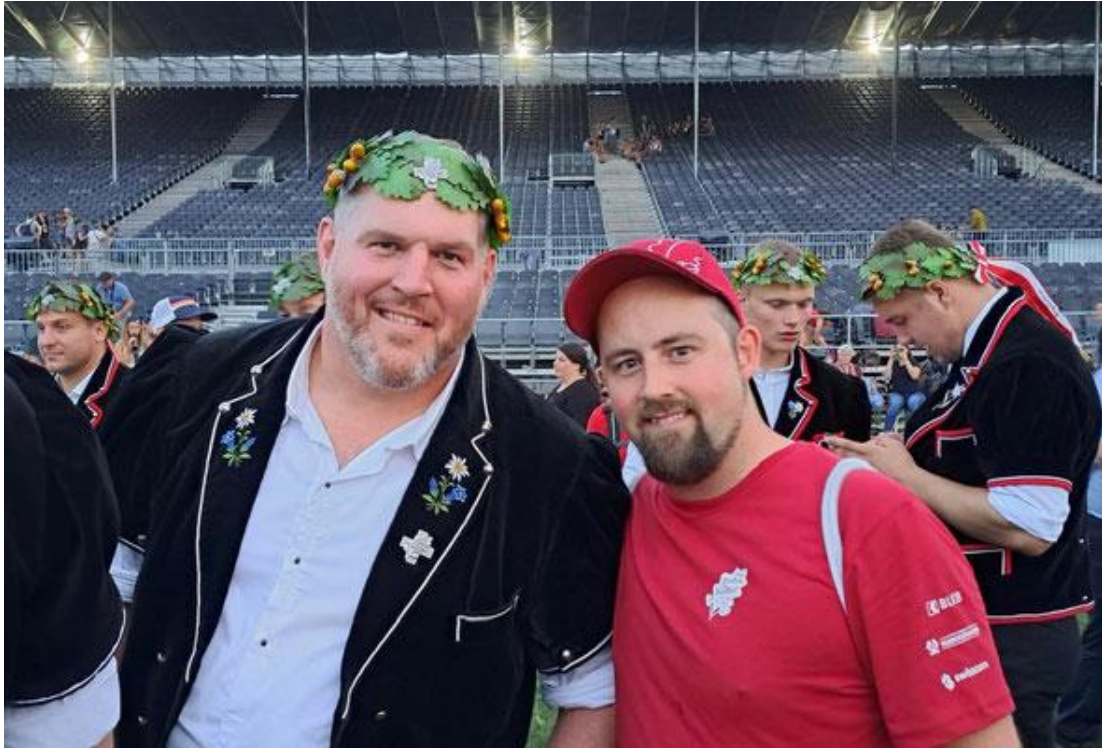
Team vom Sonntag