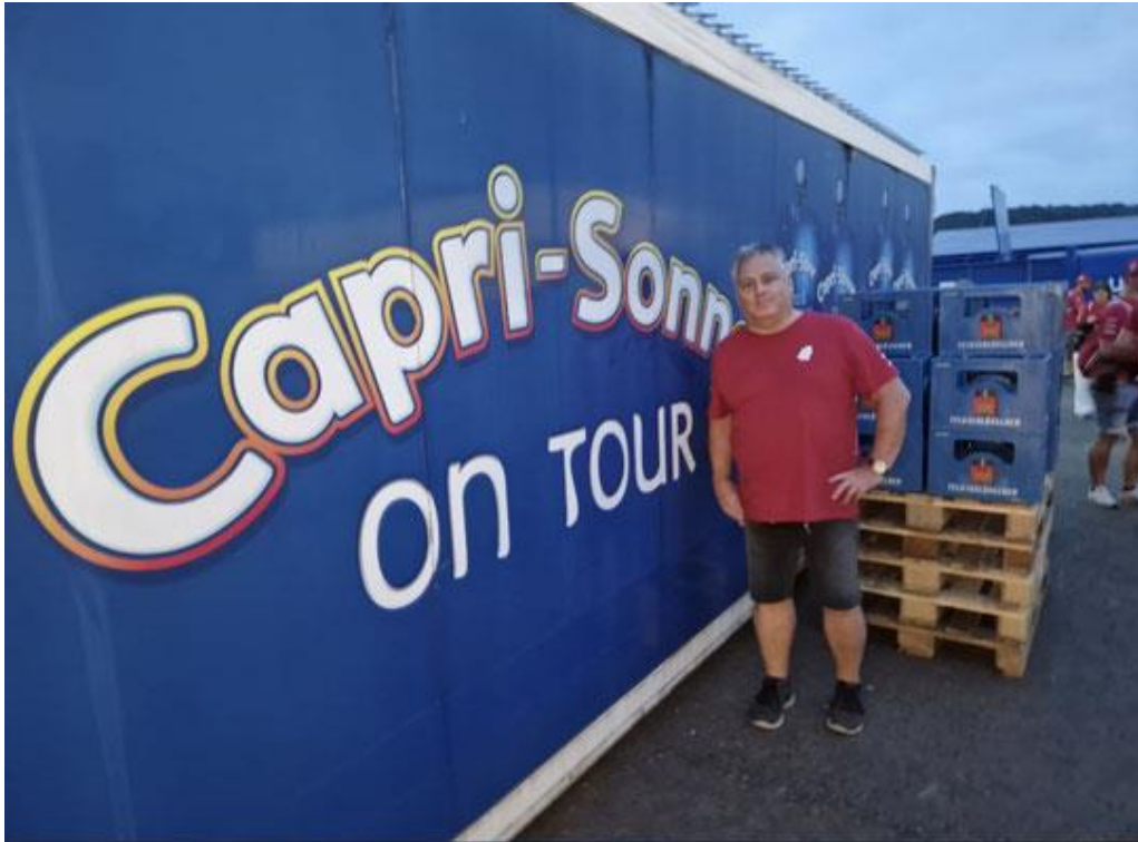
Team vom Samschtig